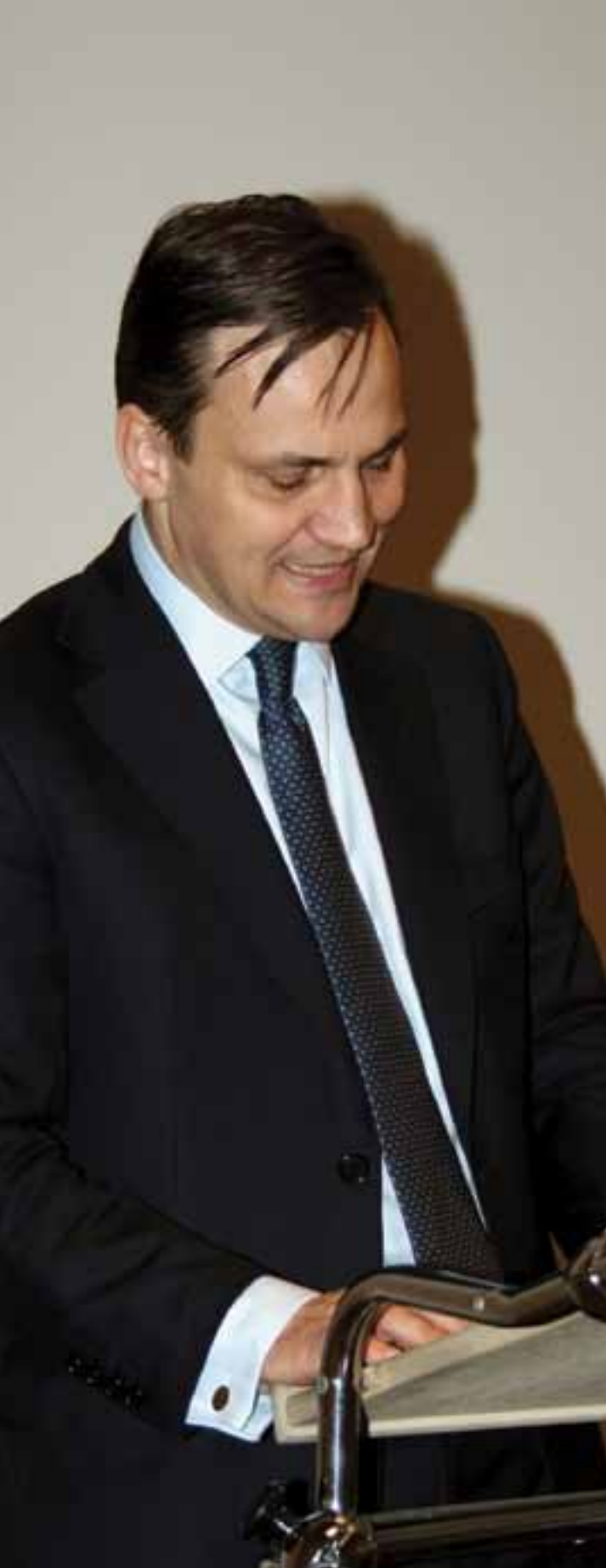
Radosław Sikorski, Minister Spraw Zagranicznych. Wykład pt. „Polska polityka zagraniczna - nowoczesna dyplomacja, współczesne wyzwania”

KSAP realizuje szkolenia we współpracy z Urzędem Komitetu Integracji Europejskiej na temat systemu prawnego, porządku instytucjonalnego oraz procesu decyzyjnego Unii Europejskiej. Szkolenia organizowane są związku z przygotowaniem kadr polskiej administracji publicznej do sprawowania przez Polskę Prezydencji w UE w 2011 r. Są one adresowane do koordynatorów spraw unijnych w instytucjach administracji rządowej, przyszłych przewodniczących komitetów i grup roboczych Rady UE, delegatów narodowych. Przeszkolonych zostanie łącznie około 1200 urzędników centralnej administracji rządowej (wrzesień 2009 r. - grudzień 2010 r.).